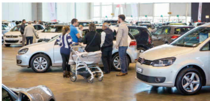
Les visiteurs ont l'embarras du choix parmi des modèles en parfait état.

Palexpo Halle 6 - Genève Du 6 au 8 octobre, de 10h à 19h, entrée libre. www.upsa-ge.ch