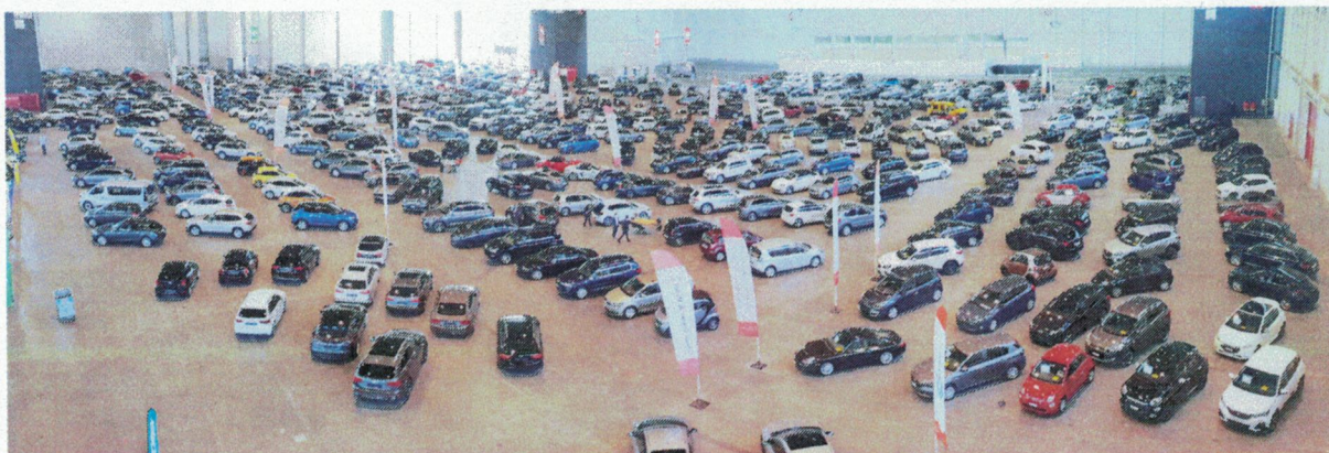
Les ventes au Salon de la voiture d'occasion de Genève ont progressé de 16 % par rapport à 2017. 35 % des acheteurs étaient des acheteuses.