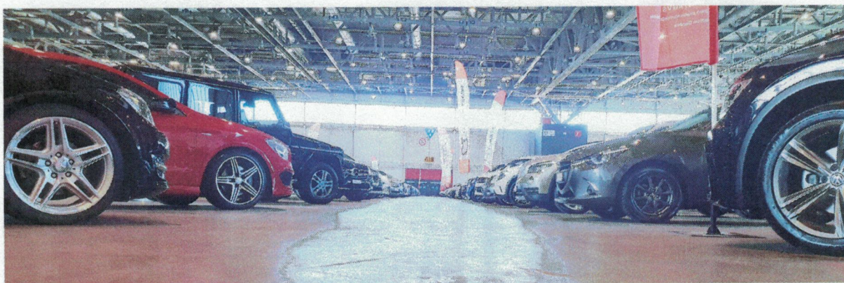
La fourchette des prix de vente s'est étendue de 3500 à 116 900 francs.

Les reprises ont augmenté de plus de 31 % avec 59 reprises, pour un chiffre d'affaires de 425 197.- francs (+ 43,7%). Une preuve supplémentaire que l'offre proposée dans le cadre du Salon de la Voiture d'Occasion de faire expertiser sa voiture en vue d'une nouvelle acquisition répond pleinement à la demande. Enfin, la voiture la moins chère a été vendue au prix de 3500.- francs, alors que le prix le plus élevé du week-end a été de 116 900.- francs. <