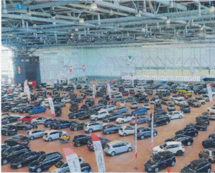
Les amateurs de belles mécaniques ont rendez-vous à Palexpo.

SALON - Organisé par la section genevoise de l'Union professionnelle suisse de l'automobile (UPSA), le Salon de la voiture d'occasion connaît année après année un succès croissant. Il est de retour du 10 au 13 octobre dans la halle 6 de Palexpo pour le plus grand bonheur des amateurs de voiture. L'un des aspects fédérateurs de la manifestation est que l'acquéreur potentiel a le choix parmi plus de 700 véhicules au même endroit, sous un même toit. Cet aspect pratique est plus qu'apprécié du public.